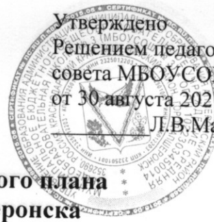
Таблица-сетка часов учебного плана МБОУ СОШ № 3 г. Апшеронска для 7 классов, реализующих федеральный государственный образовательный стандарт основного общего образования на 2021 – 2022 учебный год

Утверждено Решением педагогического совета МБОУ СОШ № 3 от 30 августа 2021 г. № 1 Л.В.Максимейко