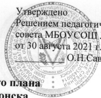
Таблица-сетка часов учебного плана МБОУ СОШ № 3 г. Апшеронска для 6 классов, реализующих федеральный государственный образовательный стандарт основного общего образования на 2021 – 2022 учебный год

Утверждено Решением педагогического совета МБОУ СОШ № 3 от 30 августа 2021 г. № 1 О.Н.Савченко